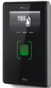
Control de presencia