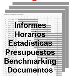
Elaboración de informes